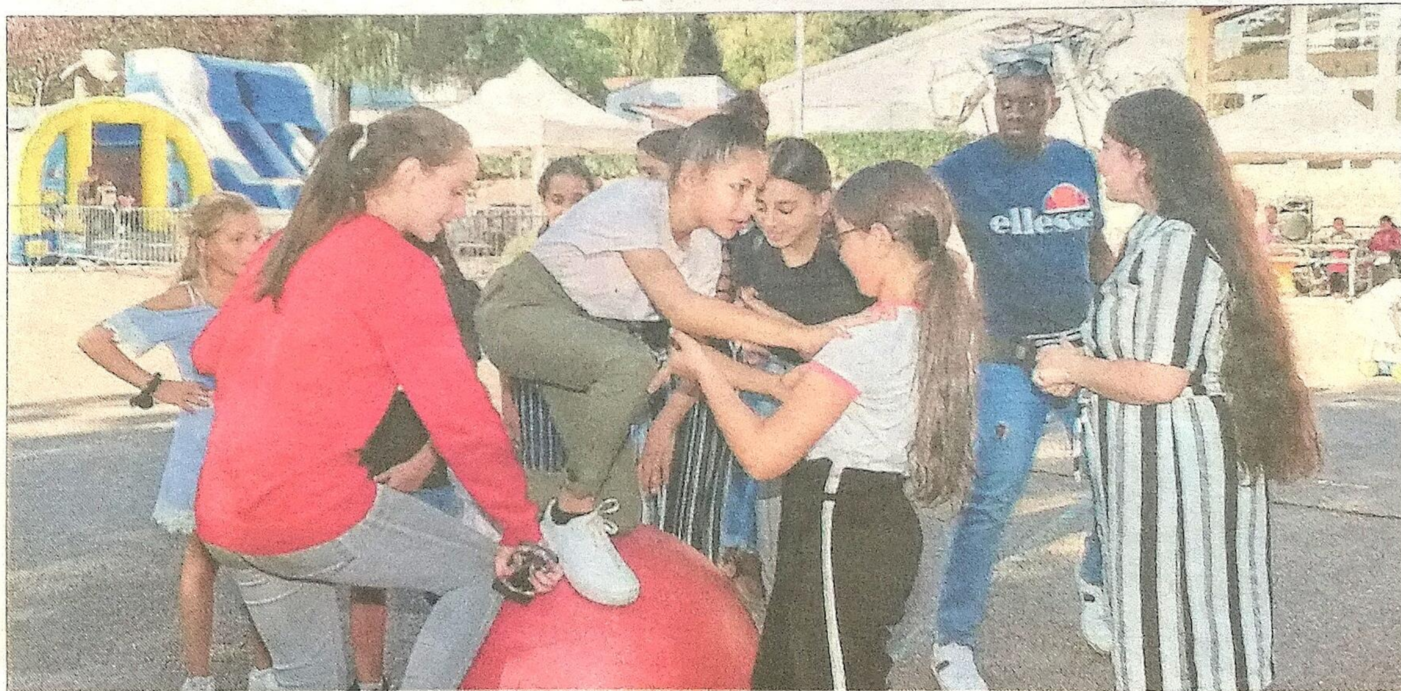
Les Nez rouges ont proposé des démonstrations dans la cour du groupe scolaire Jacques-Prévert.

Toutes les petites frimousses étaient grimées, les tours à dos de poney et la structure gonflable ont obtenu un franc succès. L'équipe des Nez rouges, qui avait amené son dragon géant cracheur de feu, a animé la pla-